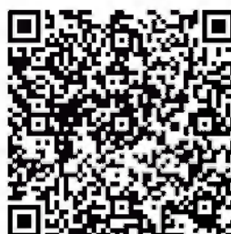
QR-код 7. Сайт творческого объединения «Отрадушка» на Google платформе

Также добавила реализуемые программы сайта Навигатор дополнительного образования. Чтобы посмотреть программу и записаться на обучение, родителю нужно просто кликнуть по ее названию.