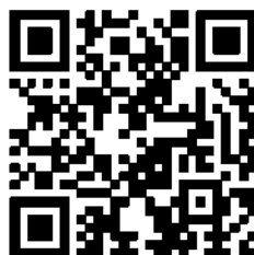
QR-код 4. Страничка творческого объединения «Отрадушка» в Instagram

Второй блок — видео-занятия, которые снимала и выкладывала на видеохостинг YouTube, также на страничку коллектива в Instagram.