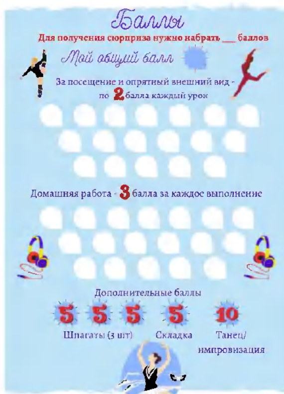
Рисунок 1. Трекер оценивания

Чтобы мотивировать учащихся заниматься, я инициировала балльную систему с наградами. Подготовила детям трекер оценивания и предложила совместно вести подсчет баллов. В конце учебного года и летней программы самые активные дети, набравшие большее количество баллов, получили призы.