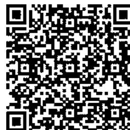
QR-код 2, 3. Примеры опросов на Google Forms

Второй блок — видео-занятия, которые снимала и выкладывала на видеохостинг YouTube, также на страничку коллектива в Instagram.